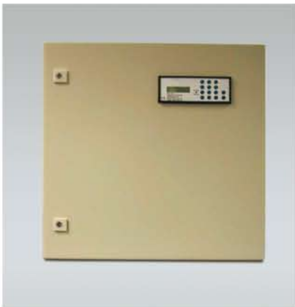
Die Vorgaben an den Explosionsschutz werden eingehalten.