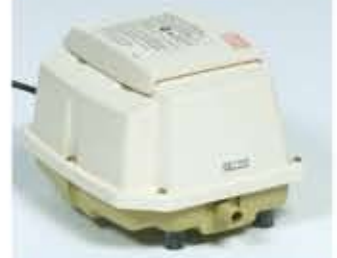
Der obige Verdichter erzeugt für eine 4 EW-Anlage nur eine Lautstärke von max. 45 dB(A), das ist flüsterleise.

Die Druckluftheber werden von einem extrem leisen Verdichter versorgt, der in einem stabilen und zusätzlich schalldämmenden Gehäuse installiert ist. Es befinden sich keine beweglichen oder elektrischen Teile in der Kläranlage selbst. Frühzeitiger und kostenintensiver Teileverschleiß durch aggressive Abwasser ist somit ausgeschlossen. Auch beim Faktor Betriebs- und Folgekosten zeigen sich „NORDIC“-Anlagen als sparsam und vielen Wettbewerbern überlegen.