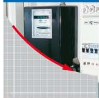
z. B. 4 EW-Anlage ca. 30 €/Jahr.