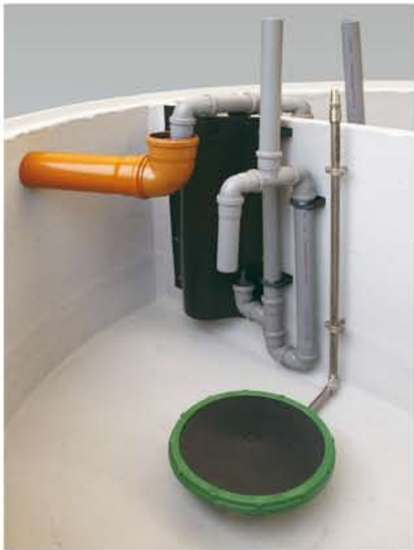
Bei der monolithischen Baureihe „NORDIC“ kann die Klärtechnik optional bereits im Werk vormontiert werden.