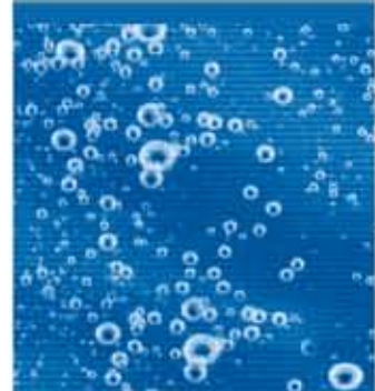
Die Sauerstoffversorgung und Umwälzung im SBR-Reaktor erfolgen von unten. Dies und die niedrigen Wassertiefen führen zu niedrigstem Energiebedarf.